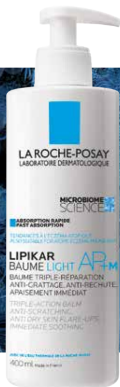
LIPIKAR BAUME LIGHT AP+M

* In vitro αξιολόγηση της ανόικτισης του S.aureus σε ανασυσταμένο δέρμα ύστερα από εφαρμογή Microresyl.