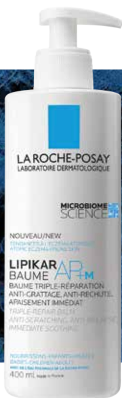
LIPIKAR BAUME AP+M