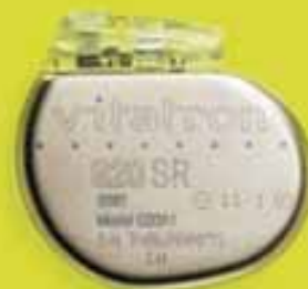
G20 SR Single Chamber