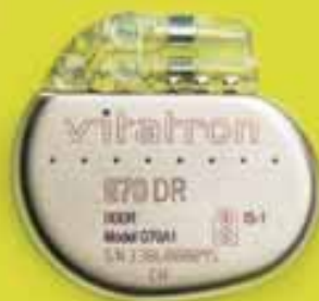
G70 DR Dual Chamber